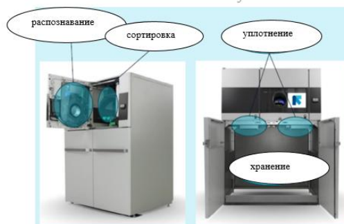
Рис. 5. (Изделие имеет два блока прессования и зону хранения, контейнеры на рисунке не показаны.)

8.1. Реверсивный торговый автомат, содержащий блоки распознавания, сортировки, прессования и хранения в едином корпусе, предназначенный для приема, распознавания, сортировки и прессования пустой тары из-под напитков (рис. 5). Автомат рассчитывает вознаграждение/возмещение и выдает чек. Автомат может иметь до трех блоков прессования и соответствующие контейнеры для хранения, мягкие контейнеры для многоразовых бутылок. В соответствии с Основными правилами интерпретации Товарной номенклатуры внешнеэкономической деятельности 1 и 6 классифицируется в субпозиции 8479 89 единой Товарной номенклатуры внешнеэкономической деятельности Евразийского экономического союза.